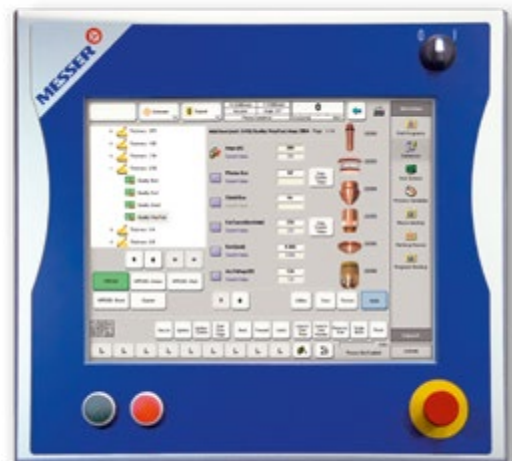
Global Control S